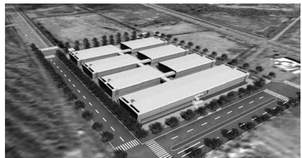
▲全体図 (最終8棟：合計4,000ラック)

石狩データセンターの進出を機に、新たなデータセンター事業者や情報関連産業の集積が図られるなど、さらなる地域経済の活性化が期待されています。